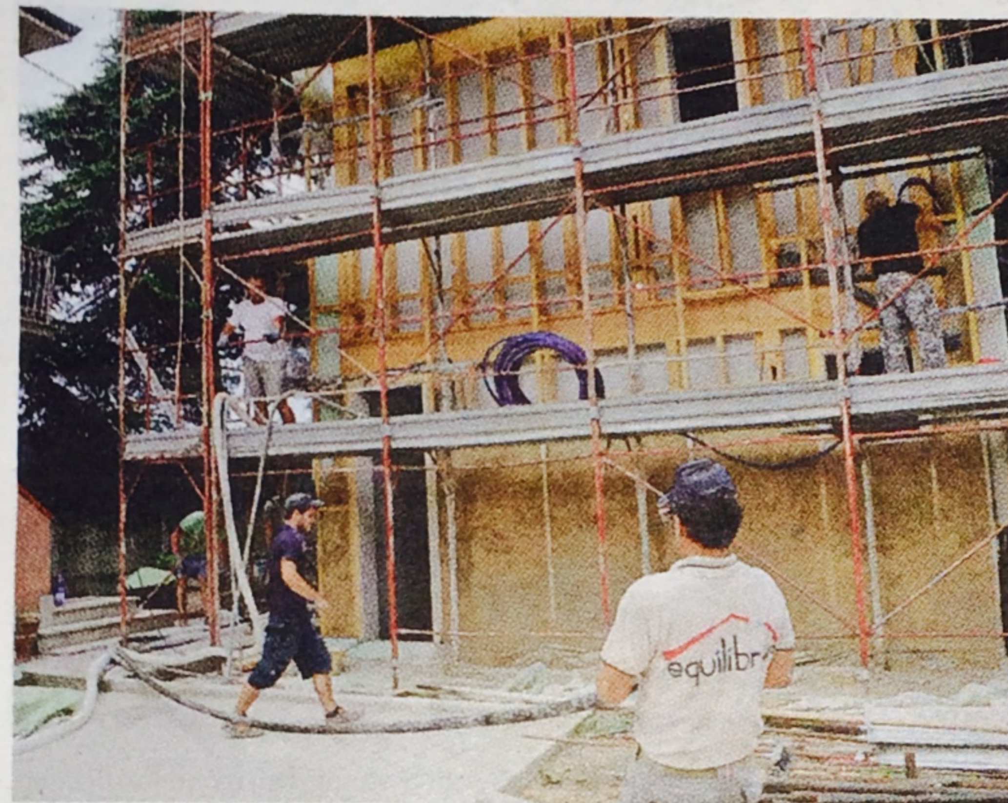
L'esterno della villetta con gli operai al lavoro