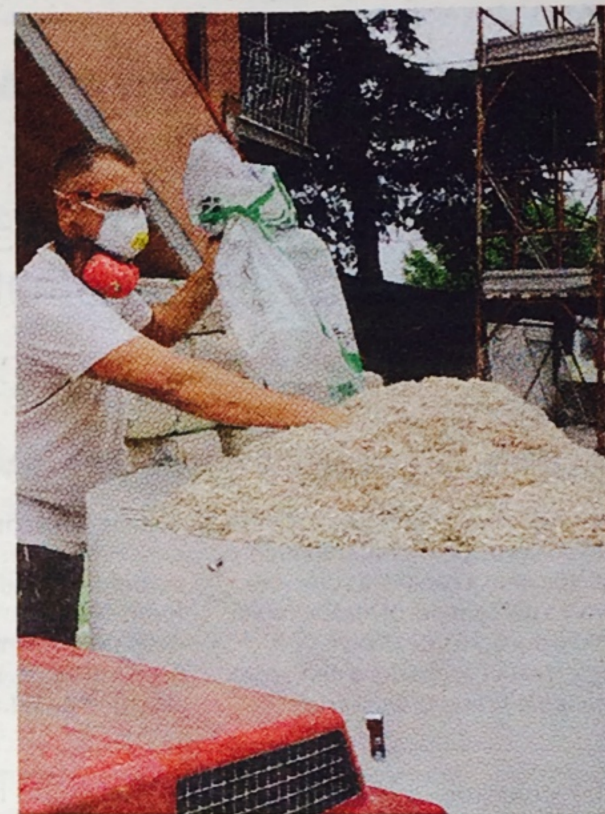
Il biocomposto di canapa e calce