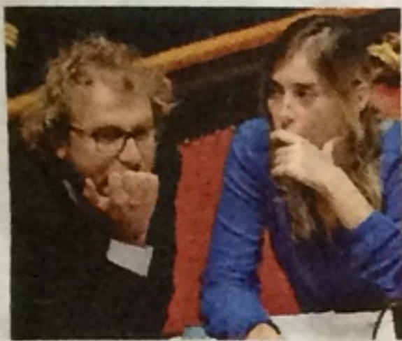
Lotti e la Boschi ieri in Senato ■ RIZZARDI A PAGINA 5

RENI: È PER LE POLTRONE Riforme, fallita la mediazione è caos in aula